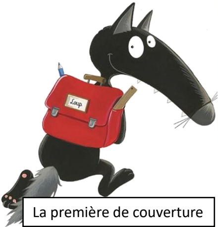
La première de couverture